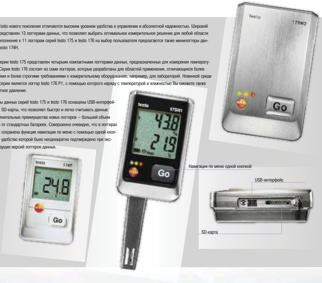
Навигация по меню одной кнопкой

Все новые логгеры данных серий testo 175 и testo 176 оснащены USB-интерфейсом и слотом для SD-карты, что позволяет быстро и легко считывать данные измерений. Дополнительные преимущества новых логгеров — большой объем памяти и питание от стандартных батареек. Совершенно очевидно, что в логгерах нового поколения сохранена функция навигации по меню с помощью одной кнопки, чрезвычайное удобство которой было неоднократно подтверждено при эксплуатации предыдущих версий логгеров данных.