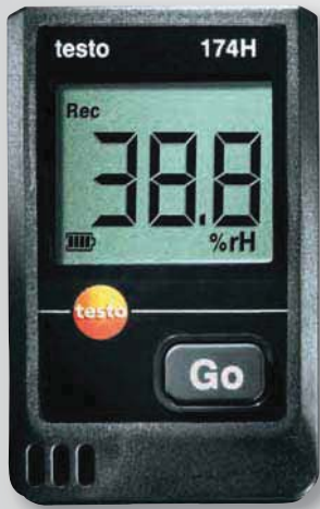
Реальный размер прибора